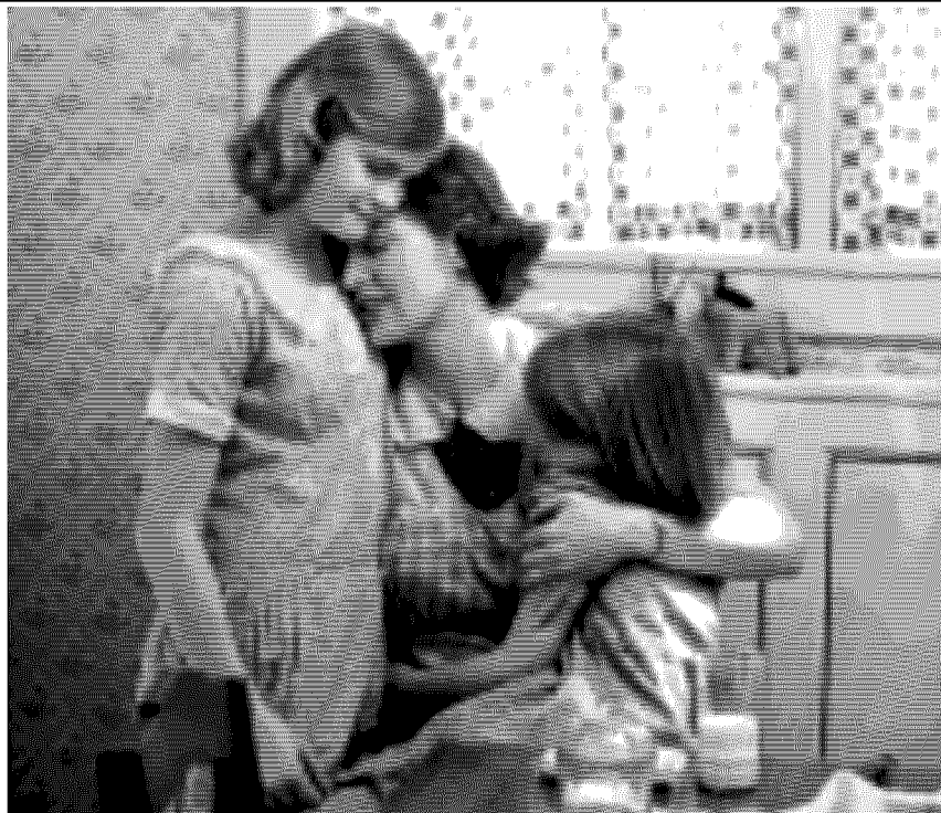
JOHN McCAIN. "Mildred Pierce" (nella foto una scena del film per la tv con Kate Winslet)